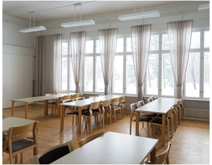
Kylätalon tiloja uudistettiin tyyliillä.