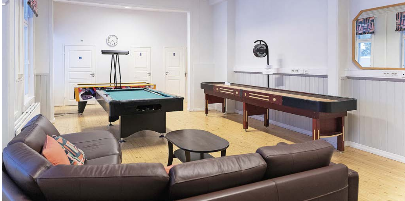
Seurankunnan järjestämä Yökahvila kokoontuu Kylätalon pelisalissa.