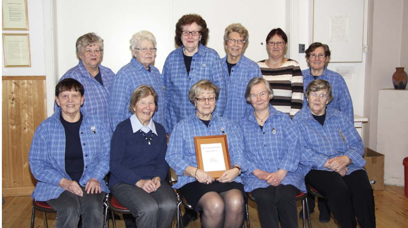
Kyläsaaren Martat valittiin vuoden kyläsaarelaiseksi vuonna 2013.