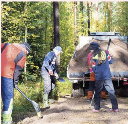
Kannessa: Kyläsaaren polkuverkkoja kunnostettiin merkittävästi.