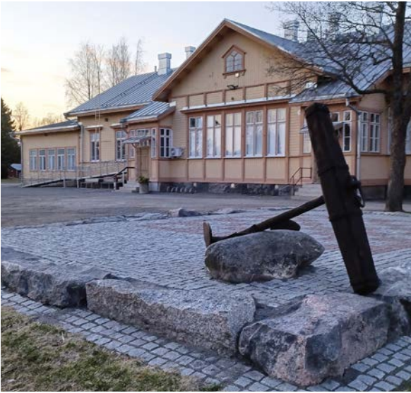
Kylätalon pihan komistus on upea esiintymislava.